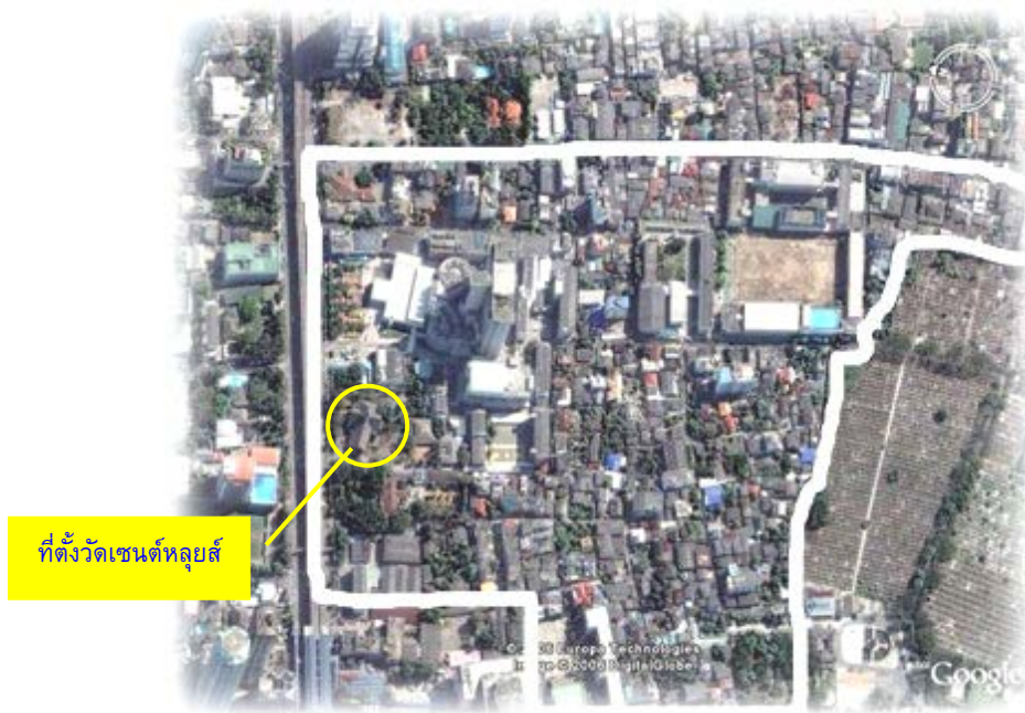
ภาพพื้นที่ที่ถูกซื้อไว้ในสมัย ฯพณฯ หลุยส์ เวย์