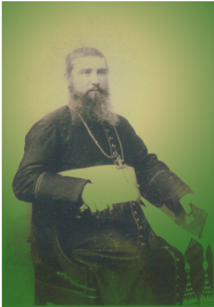
พระสังฆราช หลุยส์ เวย์ และ วัดเซนต์หลุยส์